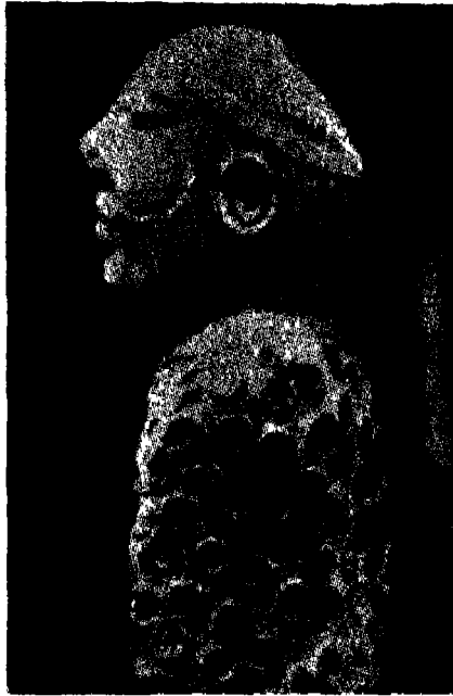
मोहन-जो-दरो के उत्खनन में

प्राप्त एक मानव-मूर्ति २०००-३००० ई० पूर्ब